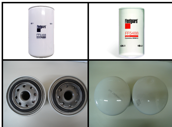
Filtro FF5488 Importado – Direita Filtro FF5488 Nacional – Esquerda

Rótulo: A principal mudança é o rótulo, aprovado pela corporação para o Brasil. O Silk possui apenas uma cor (preta) e possui um posicionamento diferente do filtro importado.